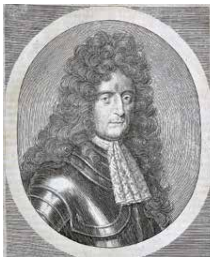
Ernestus Rudigerus Comes De Stahrenberg S. C. M. Commerarius Militiae Pedestris Generalis ac Viennae gubernator.

Wielki wezyr Kara Mustafa, dowódca armii tureckiej, m. in. pod Wiedniem - miedzioryt z dzieła Theatrum Europaeum .