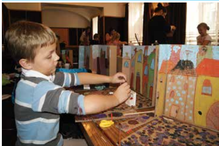
Dwa księżycy - warsztaty teatralno-plastyczne dla dzieci.