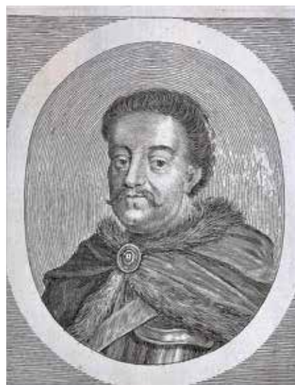
IOANNES III. D. G. REX POLONIAE MAGNUS DUX LITHUANIAE UKRAINAE.

Dowódca obrony Wiednia, generał Ernest von Stahrenberg - miedzioryt z dzieła Theatrum Europaeum .