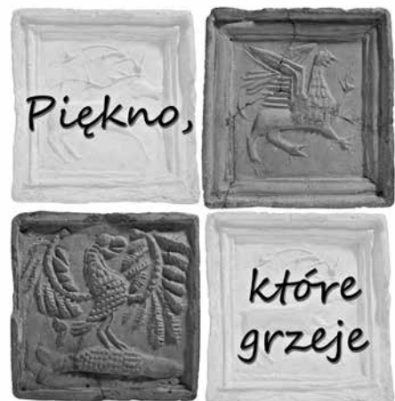
Cieszyńskie kafle piecove