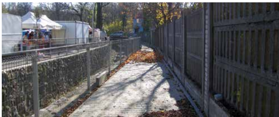
Odremontowany chodnik łączący ul. Sarkandra z ul. Stawową.