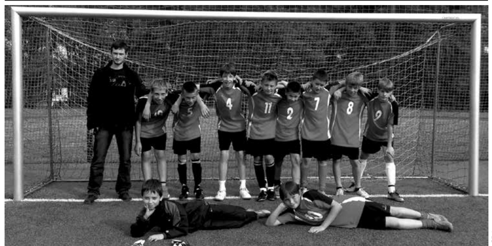
Reprezentacja SP 3 w piłce nożnej.