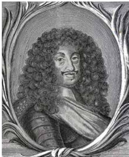
LEOPOLDUS I. D. G. ROMAN. IMPERATOR SEMPER. AUGUSTUS GERMA. HUNGA. BOHEM. REX. ETC. ARCHIDUX AUSTRIAE.