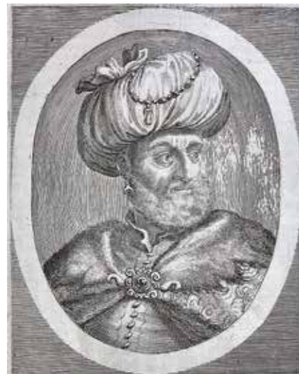
Kara Mustapha Bassa Thercarum Imperatoris Minister Primarius.

Portret cesarza Leopolda I - miedzioryt z dzieła Theatrum Europaeum .