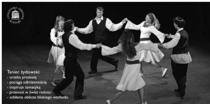
Taniec żydowski: - urzeka prostotą - pociąga odmiennością - inspirowa tematyką - przenosi w świat radości - odsłania oblicze bliskiego wschodu