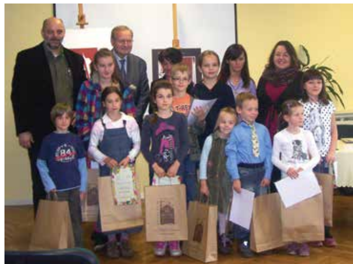
Grupa laureatów konkursu plastycznego „Literacki świat Tuwima”.