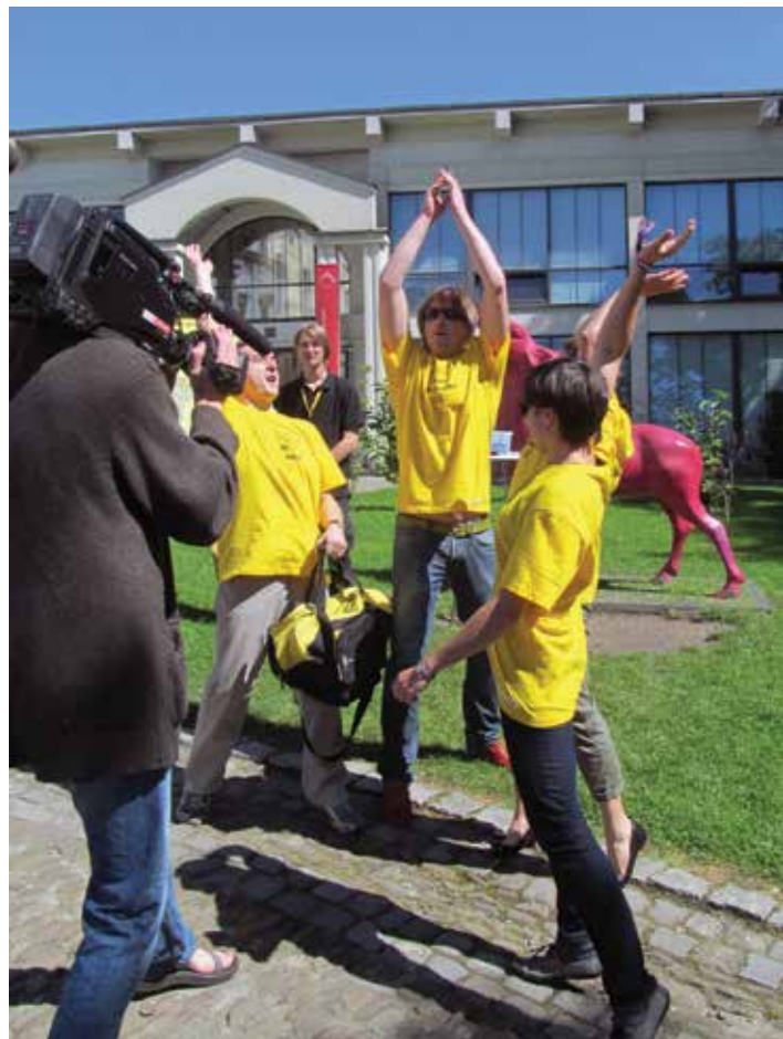
Stosunkiem głosów 72 do 28% Cieszyn pokonał Częstochowę.