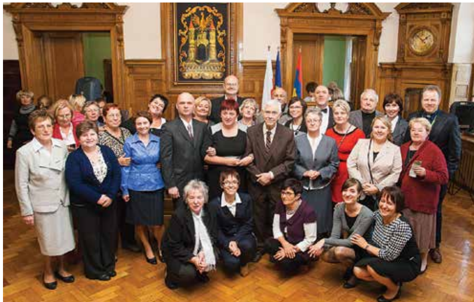
Wolontariusze Hospicjum im. Łukasza Ewangelisty.

5 października obchodzono jubileusz 15-lecia działalności Hospicjum im. Łukasza Ewangelisty w Cieszynie.