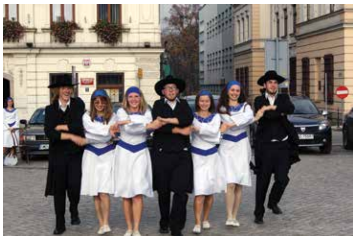
Zespół Klezmer działający w COK.