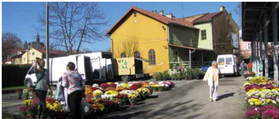
Utwardzony plac za budynkiem byłej szkoły.